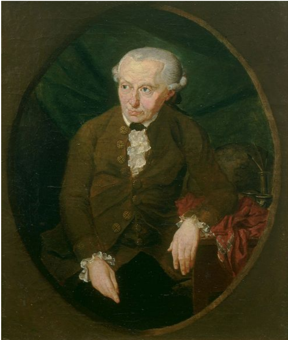
Immanuel Kant. Porträt von Gottlieb Doebler

Posted on 1. April 2020 by Hans-Jürgen Arlt Warum ich für bruchstücke schreibe.