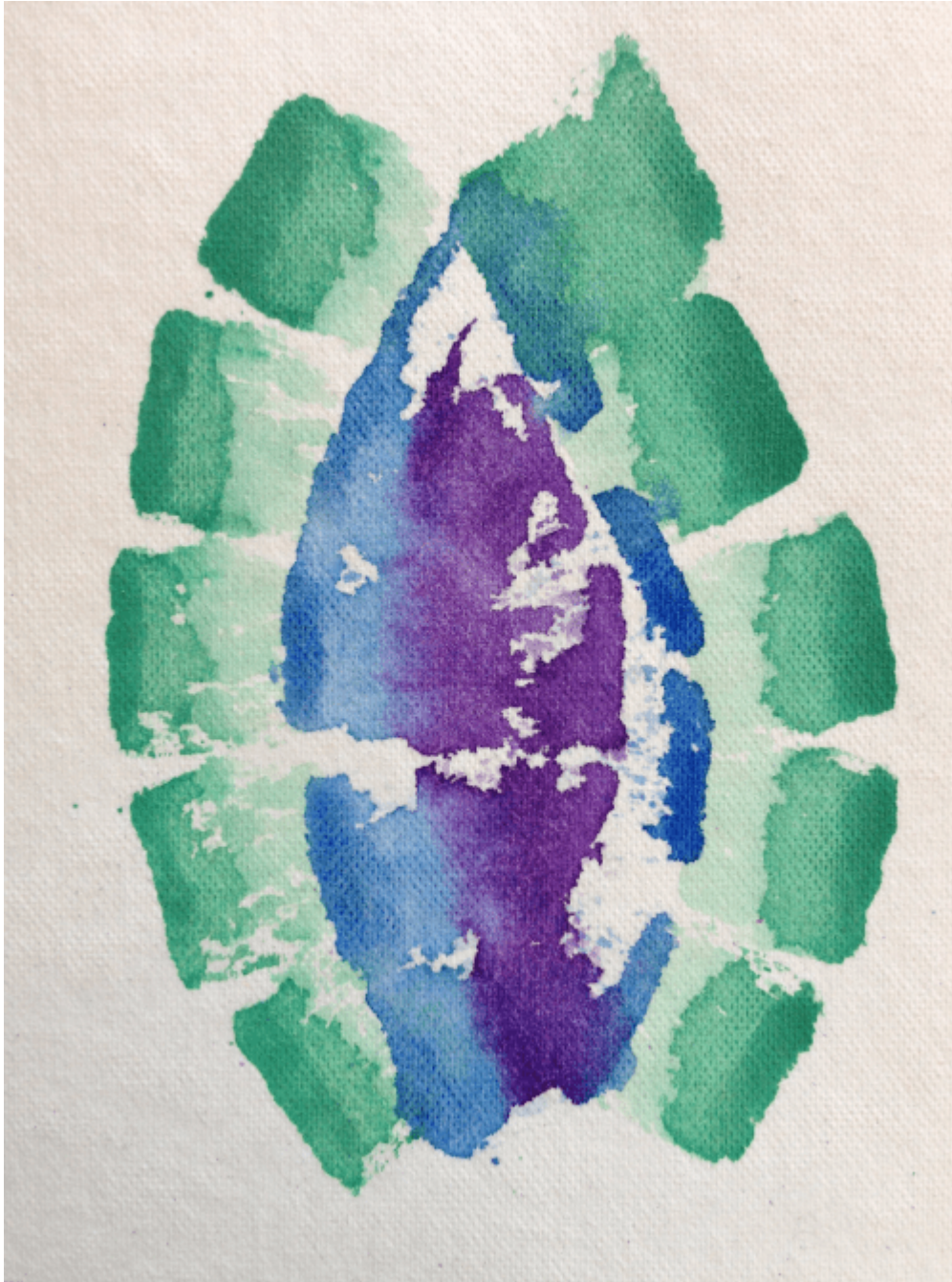
Aquarell (c) Annette C. Eckert

OK, wer weiß, wann es die nächste Krise gibt, die all die feministischen Theorien aufs deutlichste bestätigt. Deshalb noch einmal ganz von vorne und so einfach formuliert, wie es jede Frau aus der alltäglichen Praxis kennt. Ach so, Frau meint hier übrigens alle, die eben genau für das, was jetzt beschrieben wird, zuständig sind: ob bezahlt oder unbezahlt, freiwillig oder gezwungener Maßen, und unabhängig von ihrer sexuellen