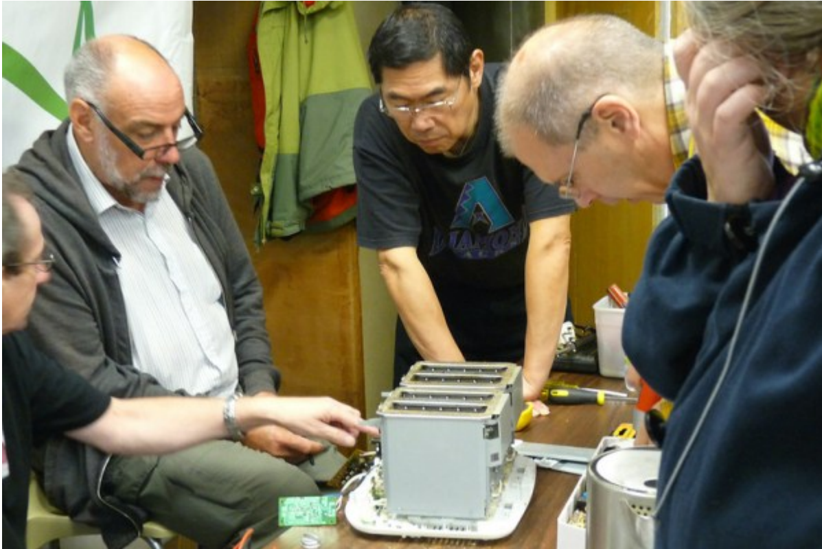
Leider konnte der Patient nicht wiederbelebt werden... Repair Café in Reading, UK

Wichtig ist die Bewegung nicht gerade, aber mehr als nichts ist das schon: Es gibt in Deutschland den Verein „Runder Tisch Reparatur“ ; er wurde im Oktober 2015 gegründet, von Unternehmen, der Verbraucherzentrale Bundesverband, dem Netzwerk Reparatur-Initiativen und dem Naturschutzbund „NABU“. Und es gibt inzwischen immerhin beinahe 800 Repair-Cafes . Und es gibt den Spezialversicherer „Wertgarantie“: Der versichert alles, was einen Akku oder Stecker hat. Geht ein versichertes Gerät kaputt, kann sich der Besitzer an den Fachhändler direkt wenden, wenn sich eine Reparatur lohnt, dann zahlt sie der Versicherer.