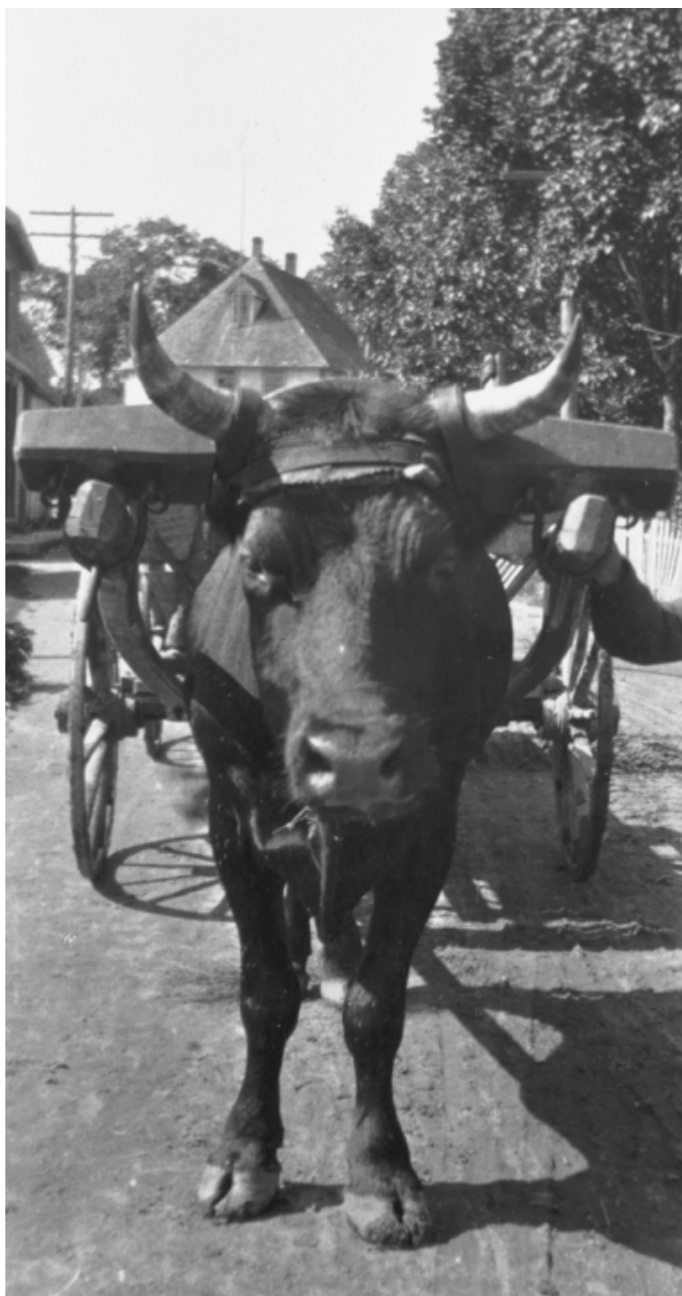
Eingespannter Ochse zum Transport von Fässern auf der Main Street, Chester Basin, Neuschottland