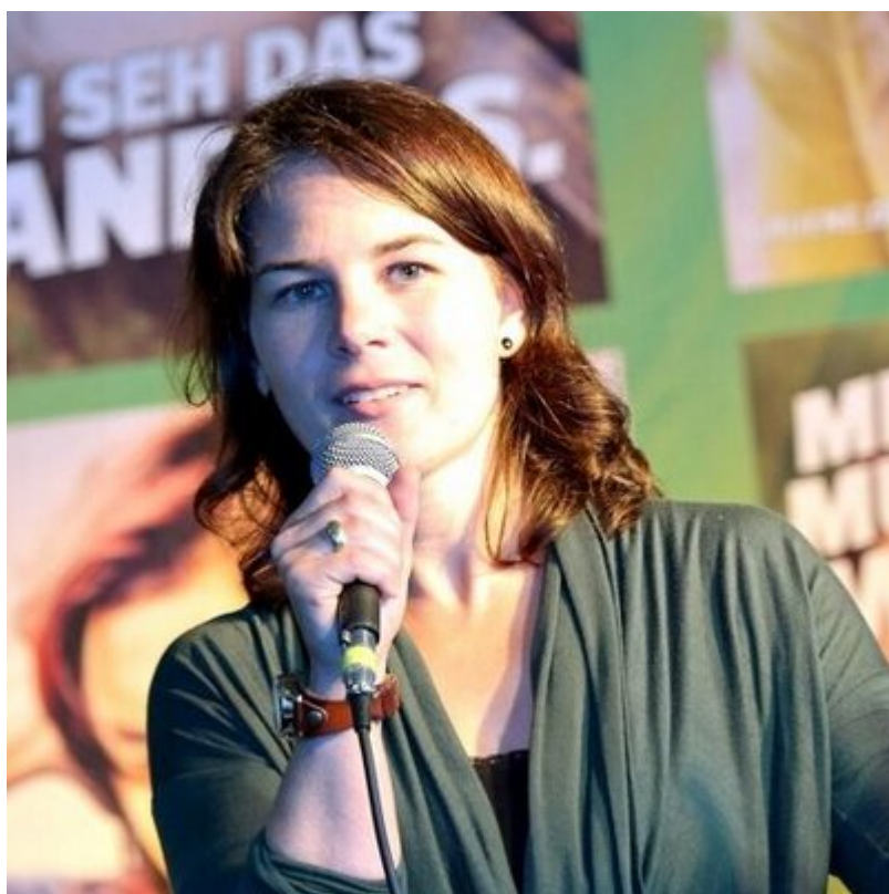
Annalena Baerbock (2013)

Jetzt könnte von Verteidigern der Grünen der Vorhalt kommen: Ja, aber das sind ja nur die Grünen in Stuttgart, Hessen und Baden-Württemberg, die Grünen im Bund um Robert Habeck und Annalena Baerbock (mit Jürgen Trittin backstage), die werden ganz anders aufdrehen. Mutig Schneisen schlagen, mit Steilpässen mutig Räume öffnen und sich auch vor Großkonflikten nicht fürchten. Na klar.