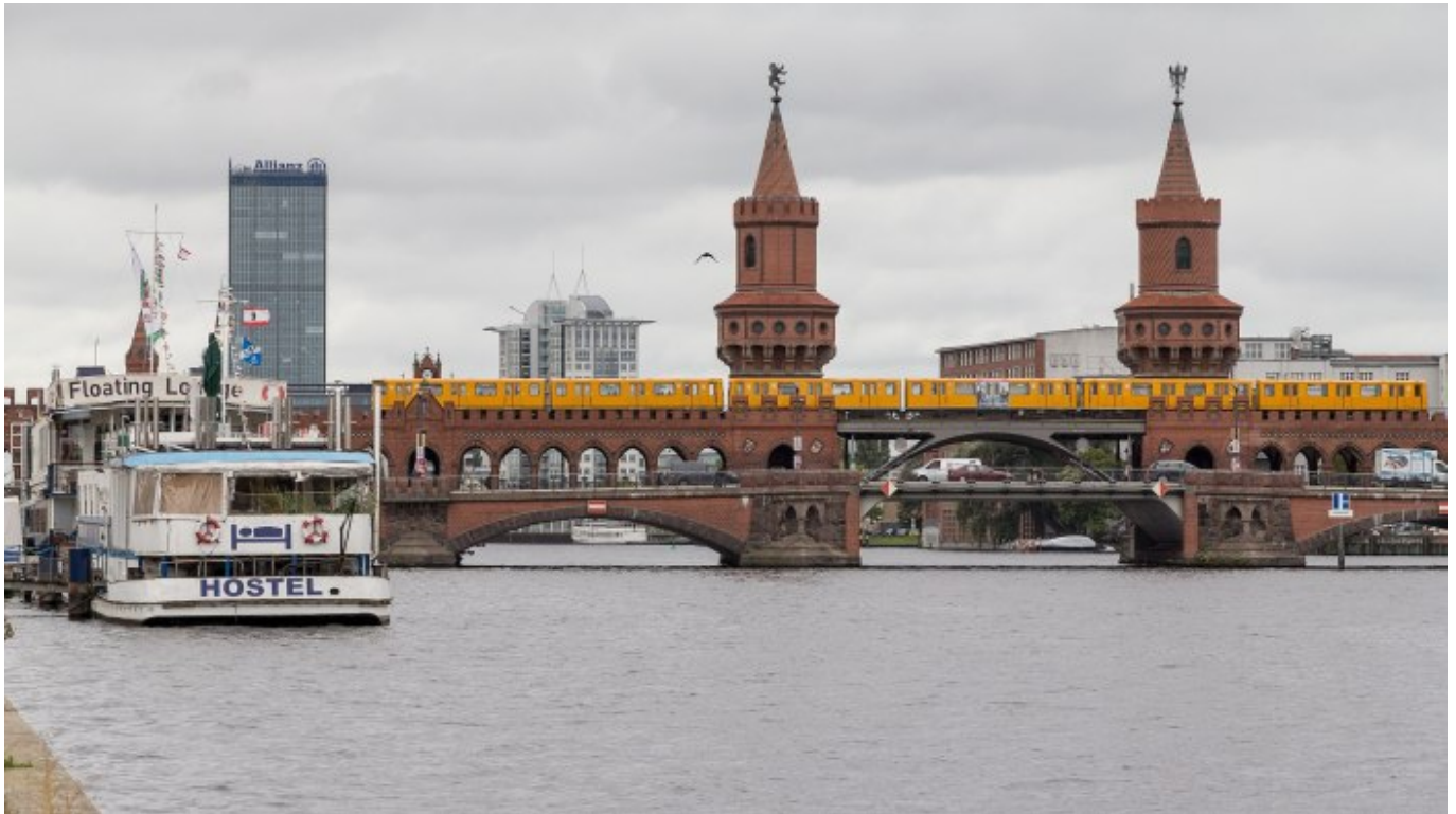
Oberbaumbrücke & Hostelboot