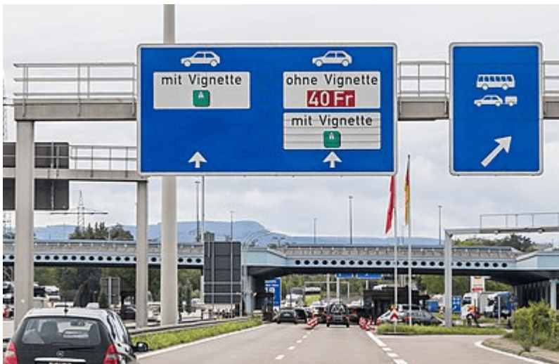
Deutsch-Schweizer Grenzübergang auf der A 5 Weil am Rhein

Wer es sich damals leisten konnte zu reisen, konnte in Europa grenzenlos reisen. Vor 1914, schrieb Stefan Zweig 1928, haben die Reisenden kein Visum gebraucht, um mit der Droschke von Paris nach Moskau zu kommen und in Berlin die Pferde zu wechseln. Sie mussten auch die Gulden und die Taler nicht wechseln. Es gab Zollgrenzen, Handelsgrenzen, aber keine Staatsgrenzen und keine Pässe. Der Nansenpass , den der Völkerbund 1922 einfuhrte, war ein Dokument, das nur vorläufigen Charakter haben sollte. Die sogenannten vier Freiheiten in der EU beziehen sich auf staatliche Grenzen. Es gilt Freizügigkeit für Personen, Waren, Dienstleistungen und Kapital. Das Paradox der Gegenwart: Europa will und braucht offene Staatsgrenzen für den Handel, aber nicht für Flüchtlinge.