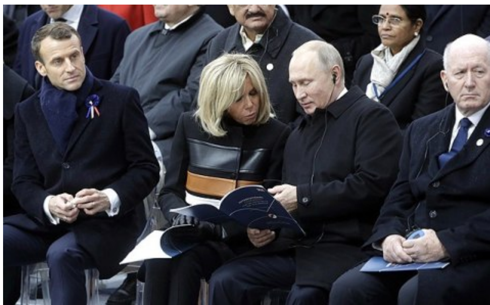
Emmanuel und Brigitte Maron, Vladimir Putin

Auf zwei Seiten im Wirtschaftsteil breitete die linksliberale Zeitung „Le Monde“ die Befunde aus (am 23. April): Sie sind ernüchternd, da sie erstmals umfangreich belegen, wie groß die Diskriminierungen nach Hautfarbe und ethnischer Herkunft im Land sind, in der Schule, auf dem privaten und öffentlichen Arbeitsmarkt, bei der Wohnungssuche. Die Jugendarbeitslosigkeit trifft vor allem 16- bis 24-Jährige, deren Mütter oder Väter aus afrikanischen Ländern südlich der Sahara gekommen sind. Die soziale und kulturelle Herkunft, die wirtschaftliche Lage der Familie und nicht zuletzt der Name und die Wohnadresse bestimmen, welche Chancen die Jungen und Mädchen haben. Ob diese Analysen, in und für Deutschland spätestens seit den Ergebnissen der PISA-Studien seit über zwanzig Jahren bekannt, zu größeren Reformschritten führen, als sie Macron wagte? Es wird zumindest eines der beherrschenden innenpolitischen Themen werden, auch wenn die Widerstände in diesem doch sehr beharrungsfesten und veränderungsunwilligen Land mit einem starken