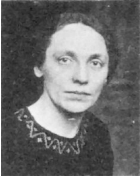
Marie Juchacz

Zu dem Verhältnis der Frauen untereinander äußerte sich Marie Juchacz sehr entschieden: „Es ist durchaus nicht so, daß die gewählten Frauen starke Neigung zeigen, sich zur Lösung der verschiedenen politischen Fragen miteinander zu verständigen oder gar zu verbinden. Ihr Einfluß kann sich nur innerhalb der eigenen Fraktion geltend machen,“ schrieb sie in einem Beitrag mit dem Titel „Die Frau als Staatsbürgerin“. 11 Ihre Fraktionskollegin Johanna Reitze aus Hamburg unterstrich diese Einschätzung mit noch deutlicheren Worten: „Die parlamentarische Zusammenarbeit hat wieder deutlich bewiesen, daß Weltanschauung und Überzeugungstreue die Haltung in allen entscheidenden Fragen bestimmen. Und das ist auch gut so. Alle Frauen unter einen Hut zu bringen, ganz gleich, welcher Klasse sie angehören, ist ein Ding der Unmöglichkeit.“ 12 Die ersten frei gewählten Parlamentarierinnen trennte vieles: Herkunft, Bildungsstand, Beruf, Status.