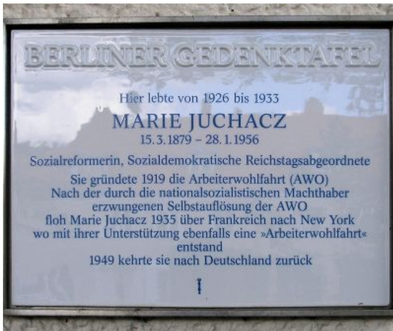
Gedenktafel am Haus Schmausstraße 83 in Berlin-Köpenick