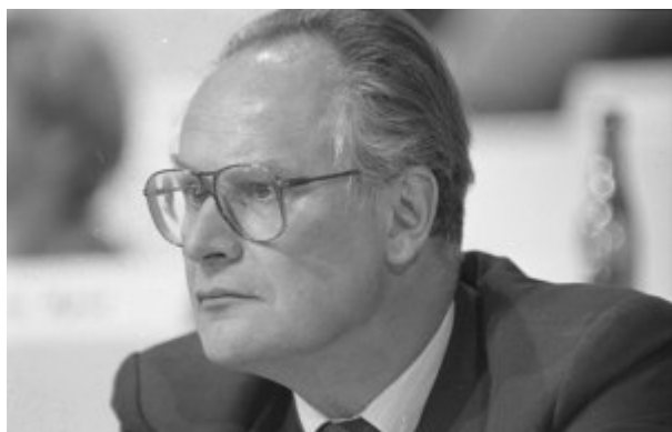
Peter Glotz