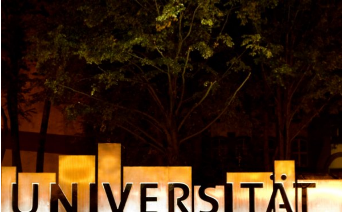
Universität Magdeburg