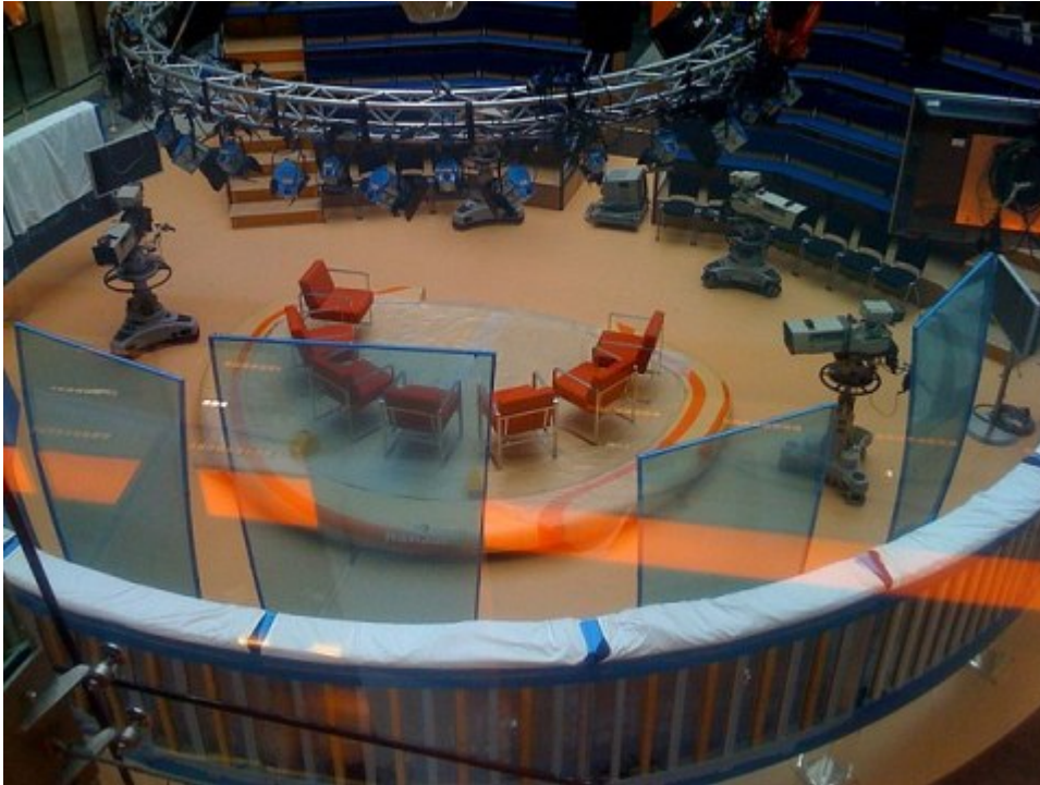
Das alte ZDF-Studio von Maybrit Illner im historischen Zollernhof, Unter den Linden 36–38, Berlin 2008

Gerne würde man die Kommentare selbst lesen. Doch wer vier Wochen nach dem Ende der Konsultation nach Ergebnissen (deren Veröffentlichung angekündigt worden war) sucht, wird auf der Webseite der Rundfunkkommission »noch um etwas Geduld« gebeten. Nach welchen Kriterien werden sie ausgewertet? Welche Bevölkerungsschichten haben sich beteiligt? Haben sich tatsächlich keine neuen Ideen oder gesellschaftliche Bedürfnisse gezeigt? Was passiert nun damit? Werden die Bürgereingaben überhaupt noch vor der Ministerpräsidentenkonferenz am 17. März veröffentlicht? Wir wissen es nicht. Bekannt ist ausweislich des Interviews nur, dass das Ganze ein Riesenerfolg war, aus dem sich praktischerweise offenbar keinerlei konkrete Folgen ergeben.