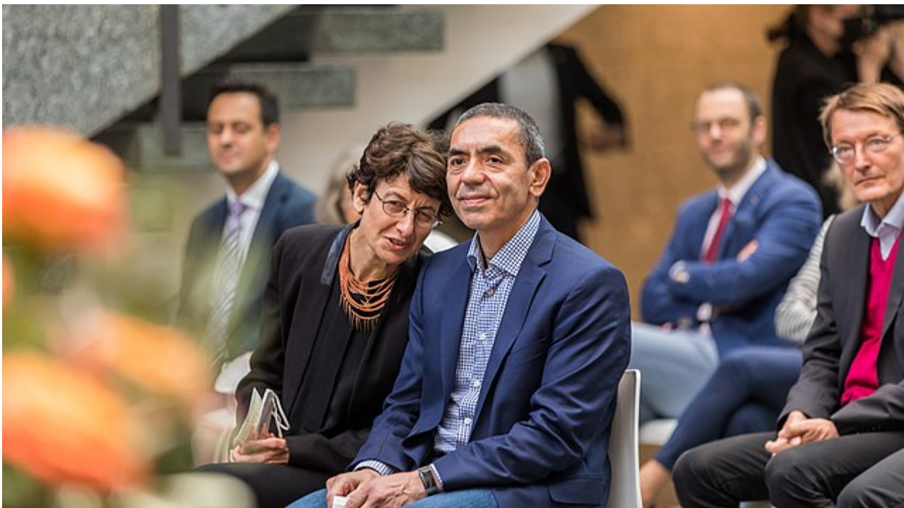
Empfang für Özlem Türeci und Uğur Şahin im Rathaus Köln und Verleihung der Ehrendoktorwürde der Medizinischen Fakultät der Universität zu Köln im September 2021

Wer sind diese beiden sehr guten Menschen und neuen zigfachen Milliardäre namens Özlem Türeci und Uğur Şahin? Das Forscherehepaar, weithin zurecht bewundert für seine wissenschaftliche und unternehmerische Leistung, entwickelte 2020 einen Impfstoff gegen das Covid-19-Virus. Jahrelang hatten die beiden über neue Krebstherapien geforscht und mit Finanziers zusammen erst das Unternehmen Ganymed Pharmaceuticals gegründet und dann 2008 Biontech. Anfang 2020 konzentrierten sie sich dann mit Unternehmer-Mut auf die Bekämpfung der zu erwartenden Covid-19-Pandemie. Und seither purzeln die Gewinn-Milliarden: Viele Staaten garantieren mit ihren Steuergeldern den ständigen hohen Aufkauf der Impfstoffe. Der Gewinnmarge kommt natürlich entgegen, dass viele Regierungen dieser Welt mit dem Unternehmen Verträge über Garantie-Abnahmen von Impfstoff zu eher stolzen Preisen abschlossen, übrigens ohne viele Worte darüber zu verlieren. Die Preisfindung ist in einem verdächtig hohen Maße intransparent; es fällt auf, dass die ähnlich wirksamen, allerdings öffentlich umstrittenen Produkte von AstraZeneca deutlich billiger als die aller anderen Konzerne sind, einschließlich Biontech.