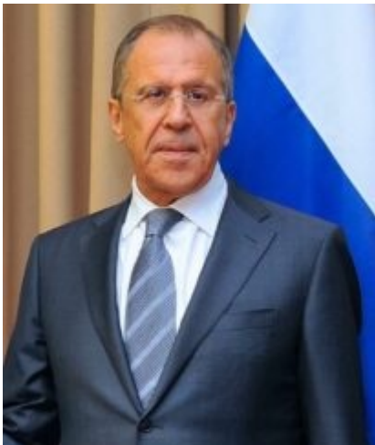
Sergey Lawrow

Wann dieses Ende kommen wird – und mit welchem Ergebnis –, ist derzeit nicht vorhersehbar. Fest steht dagegen, wer diesen Krieg vom Zaun gebrochen hat. Der russische Präsident hat nicht nur den Angriffsbefehl gegen die Ukraine gegeben, Putin hat die Invasion auch von langer Hand vorbereitet, wozu auch Lügen und systematische Täuschungsmanöver gehörten.