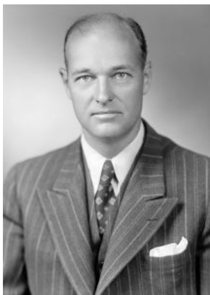
George F. Kennan (1904-2005)

Eine Osterweiterung des westlichen Bündnisses werde nicht nur „die nationalistischen, antiwestlichen und militaristischen Tendenzen in der russischen Meinung anheizen“ und damit „negative Auswirkungen auf die Entwicklung der russischen Demokratie haben“. Sie werde auch, so Kennan weiter, „die Atmosphäre des Kalten Kriegs in die Ost-West-Beziehungen zurückbringen und die russische Außenpolitik in Richtungen treiben, die uns entschieden missfallen werden“.