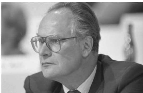
Peter Glotz

Das unterscheidet ihn von vielen, die in den aktuellen Debatten über Russland und Präsident Putin ohne historisches Hintergrundwissen daherreden und dabei die Erfahrungen und Lehren aus der Ost- und Entspannungspolitik der 1960er und 1970er Jahre nicht etwa relativieren oder überprüfen, sondern vollständig entsorgen wollen.