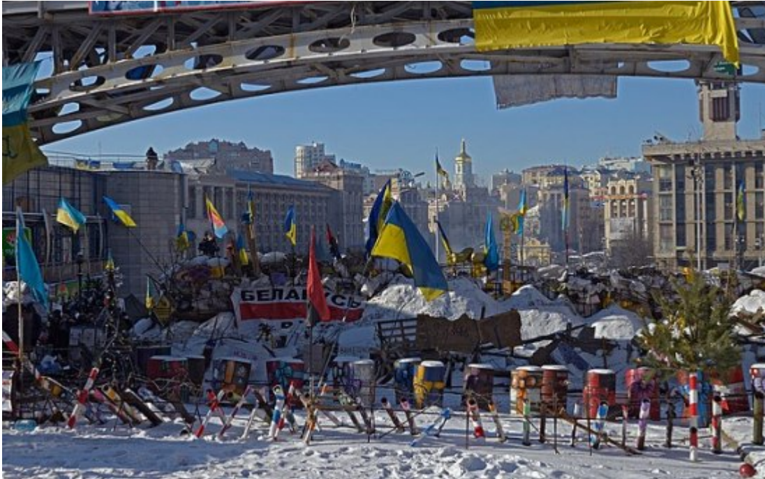
Maidan, Kiew 1. Januar 2014