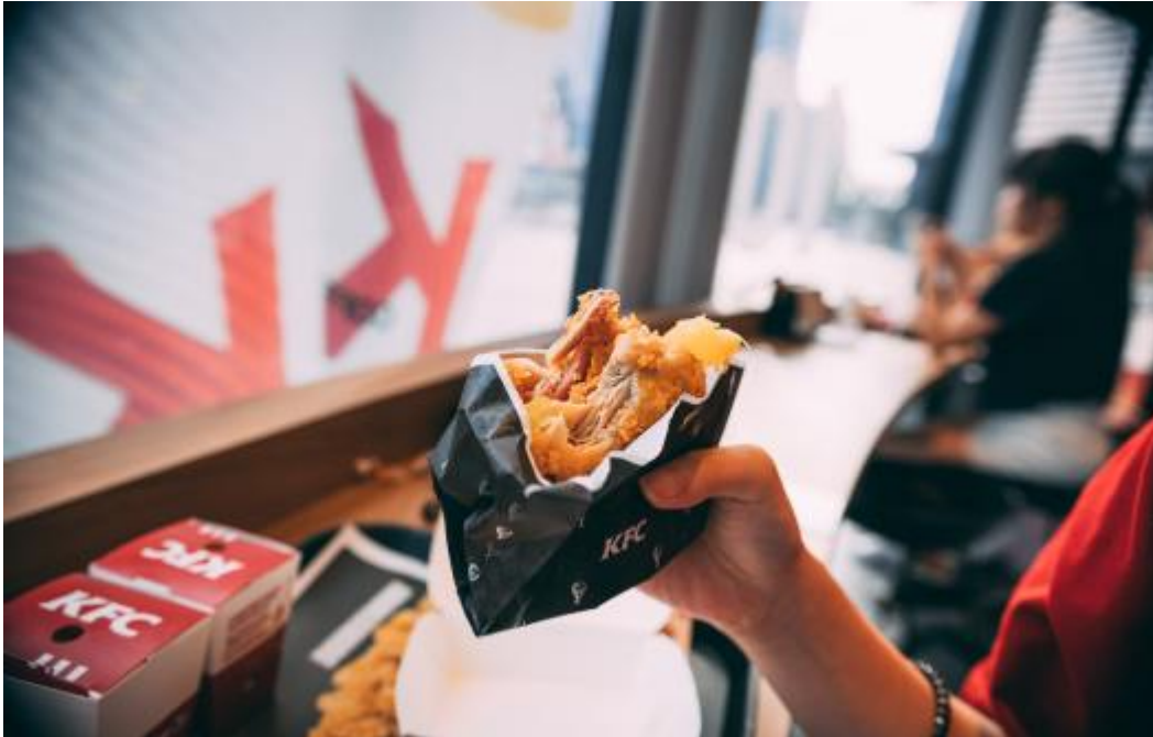
Chlorhühnchen at its finest

aus Fernost ein. In der Batterietechnik waren die deutschen Unternehmen einmal führend gewesen. Heute rennt man der Technologie hinterher und muss sie mit Milliarden von Steuergeldern wieder aufpäppeln.