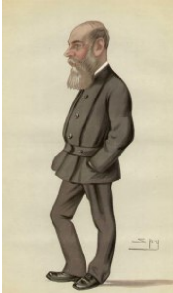
Charles Cunningham Boycott (1832-1897), eine Karikatur aus Vanity Fair von Leslie Ward

Mit dem Boykott einher geht die Ächtung, und er ist eine gewaltfreie Form des Widerstandes, der Gegenwehr, der Abwehr. Gut oder böse, richtig oder falsch - der Boykott an sich setzt nicht voraus, so oder so gedacht zu sein. Denn im finstersten Kapitel unserer Geschichte war auch »Kauft nicht beim Juden!« ein Boykott, initiiert von den Nationalsozialisten, und fast alle haben mitgemacht.