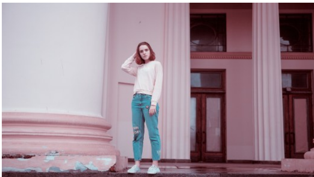
Moskaus jüngere Generation

In Deutschland denkt zumindest eine lautstarke Minderheit inzwischen: Die bisher verhängten Sanktionen schaden mehr dem Westen denn dem Kriegstreiber. Welche Erkenntnisse gibt es zu deren Wirkung?