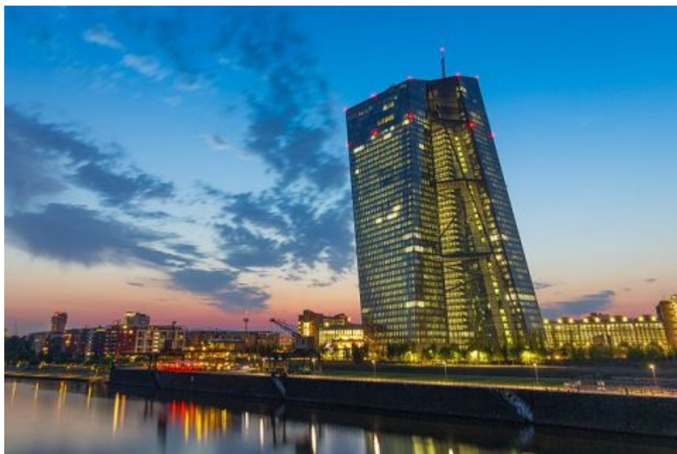
Europäische Zentralbank in Frankfurt

Ich glaube, die Finanzkrise 2007/2008 und vor allem auch die dramatische geldpolitischen Reaktion auf Covid im Frühjahr 2020 haben das inzwischen verändert. Man hat gemerkt, selbst wenn alles irgendwie vorbestimmt erscheint, gibt es dennoch Institutionen und Personen, die durchaus Macht haben. Das sind aus meiner Sicht die Ansatzpunkte, an denen eine Linke sich wirklich politisch engagieren sollte, um kreativ darüber nachzudenken, wie man diese Machtpunkte am besten sichtbar machen kann. Das erfordert natürlich politischen Kampf, aber mit der richtigen Strategie zum richtigen Zeitpunkt kann man da durchaus Effekte erzielen.