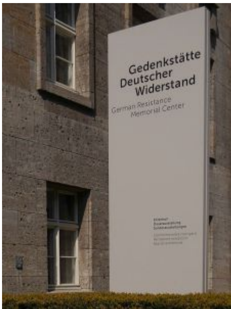
Stein vor der Gedenkstätte Deutscher Widerstand in Berlin, 2017 in der Stauffenbergstraße

Schon bald nach dem Krieg wurde dem Rommel-Mythos eine weitere Facette hinzugefügt. Es gab Material, das ihn mit den Hitler-Attentätern vom 20. Juli in Verbindung brachte. In seinem 1949 veröffentlichten Buch „ Invasion 1944. Ein Beitrag zu Rommels und des Reiches Schicksal “ behauptete dessen früherer Stabschef Hans Speidel, sein Vorgesetzter habe vom Attentat am 20. Juli 1944 auf Hitler gewusst und es unterstützt. Wegen dieses Vorwurfs war Rommel im Oktober 1944 auf Befehl des Diktators zum Selbstmord gezwungen worden. Die offizielle Version der Nazis: Rommel sei bei einem Autounfall in Folge einer Embolie gestorben. In Wahrheit hatte sich Rommel mit Zyankali-Kapseln das Leben genommen. Fortan galt Rommel nicht mehr nur als militärisches Genie, sondern auch als Widerstandskämpfer, als der „gute Deutsche“, der unter dem Hitler-Regime seine moralische Integrität gewahrt hatte. Rommel war zwar nie Mitglied der NSDAP, galt aber als begeisterter Anhänger Hitlers und hat dessen Regime und Kriegspläne gestützt. Rommel war eine Reizfigur. Nicht nur in seiner Heimatstadt.