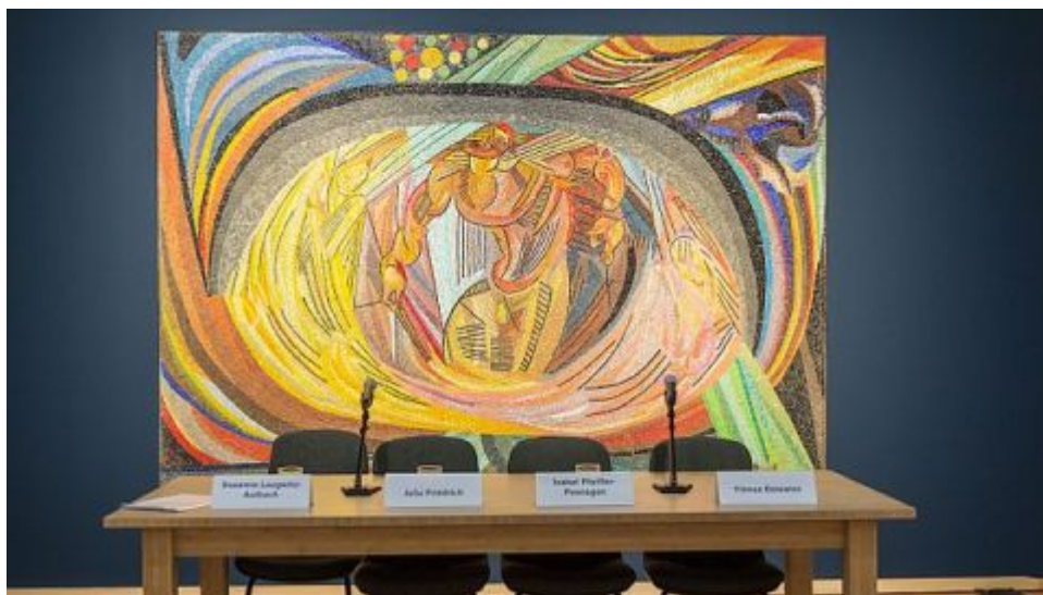
Otto Freundlich: Kosmischer Kommunismus-9690.

Linke Politik greift dieses Unbehagen, das Gefühl wie auch das Wissen auf, dass es so, wie es ist, nicht gut ist bzw. nicht gut gehen kann, und übersetzt es in politische Energie, in kollektive Kräfte der emanzipatorischen Veränderung. Sie bearbeitet die Spannung, die Ungleichzeitigkeit zwischen „Wie es sein sollte und könnte“ und „Wie es tatsächlich ist“, sie reflektiert den Unterschied zwischen den Möglichkeiten notwendiger Veränderung und den je eigenen Möglichkeiten individuellen Handelns. Sie beschreibt, wie es besser sein könnte und warum es „machbar“ wäre. Sie zeigt und öffnet Wege, damit Bürgerinnen und Bürger aktiver Teil gesellschaftlicher Transformation werden können.