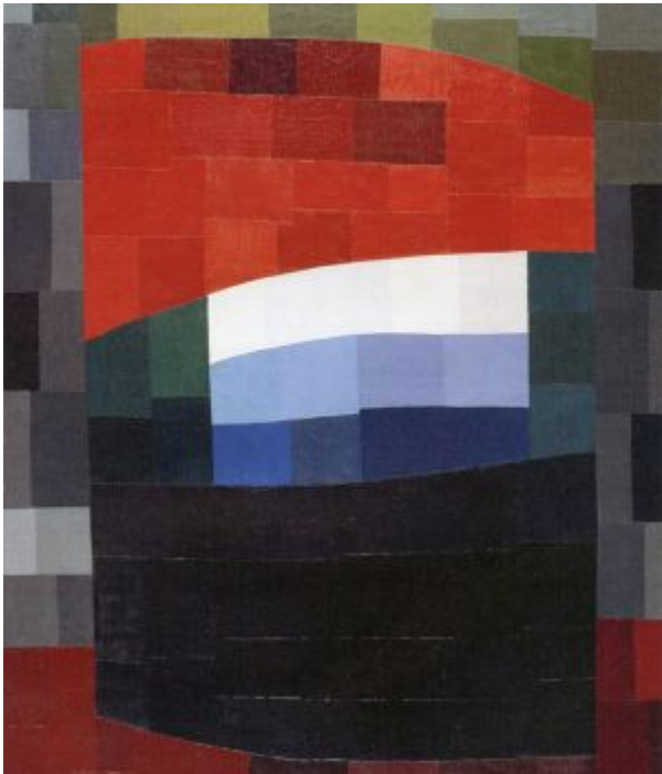
Otto Freundlich (1878-1943): Mein roter Himmel

Posted on 27. Dezember 2022 by Bruchstücke Bot