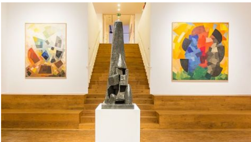
Otto Freundlich: Kosmischer Kommunismus-9679 Ausstellung im Museum Ludwig in Köln, Februar 2017

Schließlich zählen zum Linkssein Solidarität, Gemeinschaft, Kooperation, Fürsorge füreinander. Menschen sollten miteinander kooperieren, sich wechselseitig moralisch verpflichtet fühlen und an den Belangen anderer interessiert sein. Solidargemeinschaften wie Nachbarschaften, Vereine, Organisationen, Dörfer und Städte, auch Nationen sind immer auch Schutzgemeinschaften und beweisen sich in der Not. Gemeinschaften jedweder Art haben Zutrittsregeln, gerade auch für die Inanspruchnahme von Solidarität in einem Verein, einer Gewerkschaft, einer Solidarkasse, in einem Nationalstaat. Sie unterliegen einer fatalen Dialektik: Je stärker dieses Gemeinschaftsgefühl mit starren Grenzen der Zugehörigkeit und Mitgliedschaft verbunden ist – oft Bedingungen für ein hohes Maß an innerer Egalität – desto repressiver kann es alle ausschließen, die nicht dazugehören. Solidarität ist nicht per se links, sondern nur im Zusammenspiel mit den anderen linken Maßstäben zur Bewertung gesellschaftlicher Institutionen und sozialer Strukturen. Diese Maßstäbe selbst stehen in einem widersprüchlichen Verhältnis zueinander: die Abwesenheit von Mangel für alle gleich zu gewährleisten, birgt die Tendenz zur Unfreiheit (Max Horkheimer 1981 [1968]).