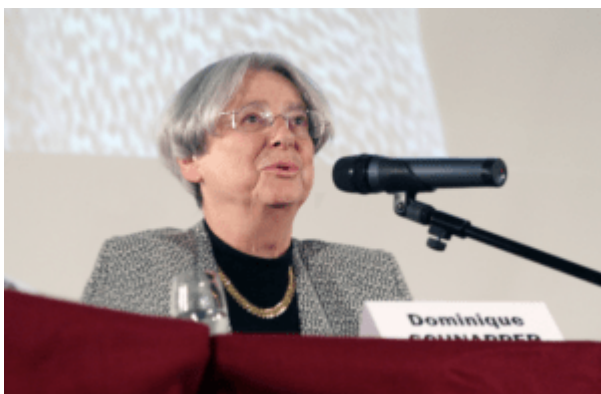
Dominique Schnapper

Doch welche Antworten sucht eine Gesellschaft, wenn Lehrerinnen und Lehrer die vier Wände ihrer