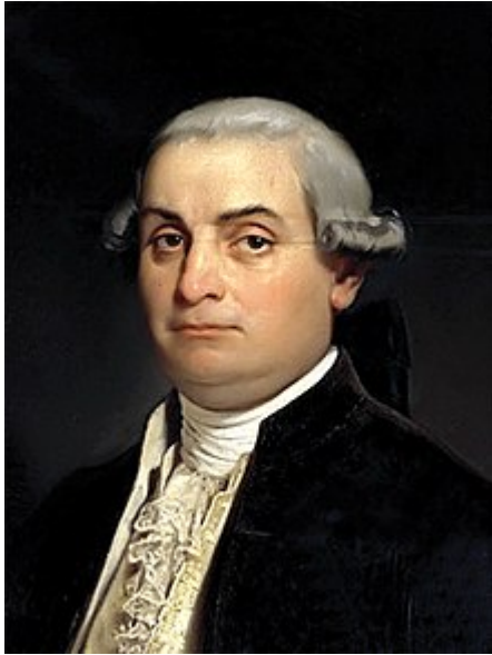
Cesare Beccaria

Noch ehe das Verfahren definitiv abgeschlossen ist, erscheint ein Buch, das für die nächsten hundert Jahre und darüber hinaus gleichsam das Manifest der Gegner der Todesstrafe werden sollte. Es trägt den Titel Über Verbrechen und Strafe und stammt aus der Feder von Cesare Beccaria , einem 25-jährigen Mailänder Juristen. Der Todesstrafe sind darin gerade einmal zehn Seiten gewidmet, doch diese Seiten sind es, die das Buch berühmt machen. Hier wird das erste Mal die Todesstrafe als unrechtmäßig grundsätzlich verworfen, weil niemand das Recht habe, sich selbst zu töten und deshalb auch niemand imstande sei, ein solches Recht wirksam auf andere oder an die Gesellschaft abzutreten, darüber hinaus als ganz und gar nicht notwendig befunden, weil die lebenslange Freiheitsstrafe die Allgemeinheit nicht weniger gut vor dem Täter sichere als der Vollzug der Todesstrafe. Schließlich heißt es in dem Buch, die Abschreckung Dritter vom Verbrechen werde durch den Anblick des lebenslangen Leidens des Eingesperrten eher erreicht als durch das schnell vorübergehende Schauspiel der Hinrichtung.