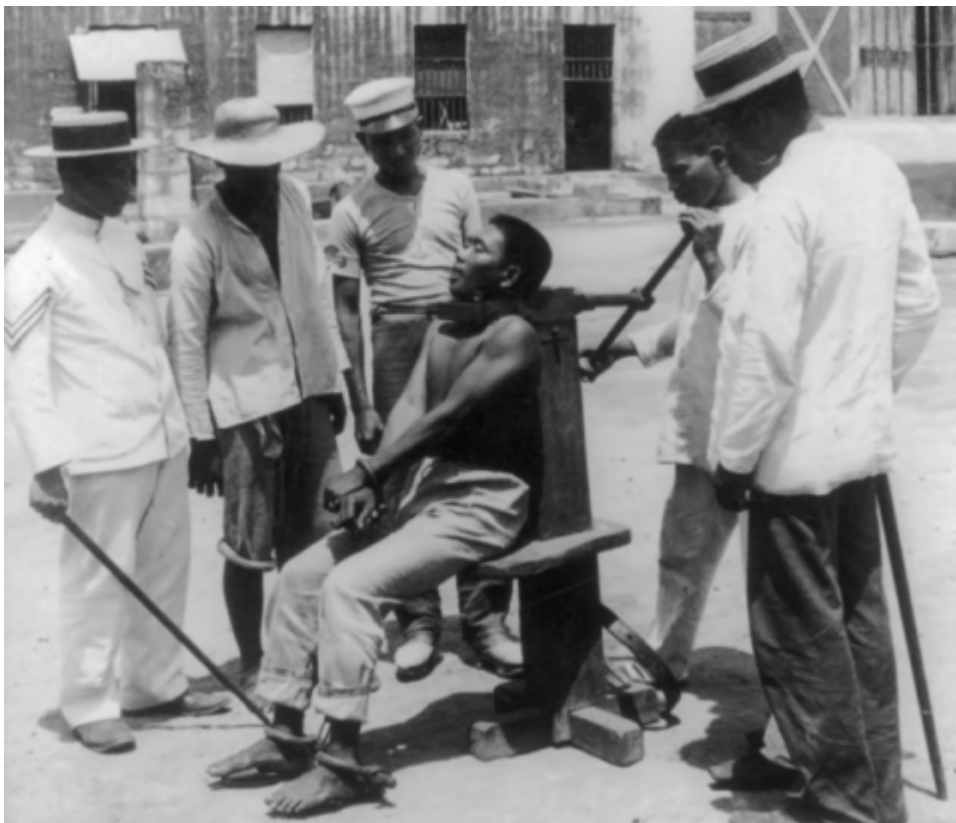
Hinrichtung im Bilibid-Gefängnis, Manila

In den letzten 250 Jahren haben sich - in der westlichen Welt - die Argumente für oder gegen die Todesstrafe vor allem auf zwei Grundsätze konzentriert: den der Abschreckung und den der Vergeltung. Die These, dass eine so unwiderrufliche Strafe wie der eigene Tod Menschen davon abhält, abscheuliche Verbrechen zu begehen, ist seit dem 18. Jahrhundert von zahlreichen Autoren angezweifelt worden. Strafrechtler, Psychologen, Mediziner, Politiker, ja Philosophen, wiesen auf zweierlei hin: Der rational planende Täter geht davon aus, dass er nicht gefasst wird, während diejenigen, die in der Erregung des Augenblicks eine schwerste Gewalttat wie etwa einen Mord begehen - und das sind die allermeisten - nicht in der Verfassung sind, die Folgen ihres Handelns abzuwägen oder zu kontrollieren, „es passiert“.