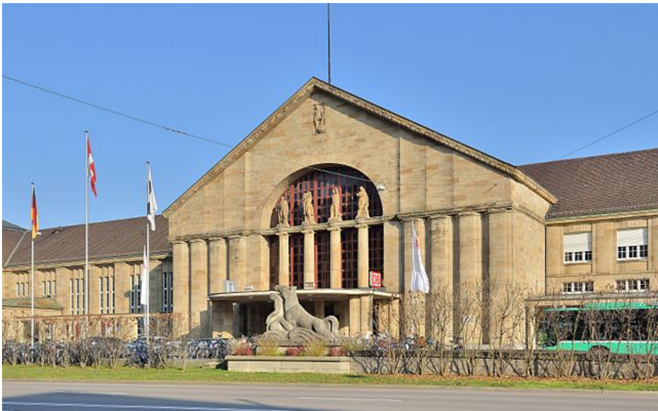
Basel Badischer Bahnhof

Als der Regionalzug im Badischen Bahnhof eintrifft, steht der ICE schon auf einem anderen Gleis. Es ist zwar nicht dasjenige direkt gegenüber, aber das gut sichtbare Gleis auf dem benachbarten Bahnsteig. Die Zugladung an Fahrgästen steigt aus und zwängt sich durch den Gang nach unten. Die Situation gleicht einem gefüllten Waschbecken, dessen halb verstopfter Ablauf dem Wasser nur langsam erlaubt, abzufließen. Als die Masse sich nach unten bewegt, den Verbindungsgang genommen und die Treppe zum nächsten Gleis überwunden hat, nimmt sie wahr, ja realisiert sie, dass der Zug, den sie soeben noch stehen sah, abgefahren ist.