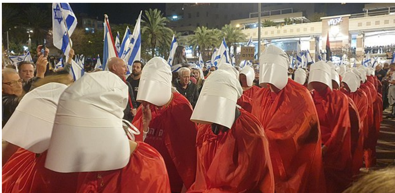
Demonstration in Kfar Saba, 11. 3.2023

Hingegen ist die Bereitschaft Hunderttausender Israelis, für Gerechtigkeit und Wahrheit zu kämpfen, eine ermutigende und aufregende Überraschung. Doch weil der Staatsstreich derart grob und stur umgesetzt wird, gibt es noch immer solche, die darin irgendeinen authentischen Ausdruck zu sehen vermeinen. Zweifelsohne spielt sich derzeit in jedem uns ein gewaltiges Drama widersprüchlicher Identifikationen ab, das erkannt werden muss und nach Formen des Ausdrucks sucht. Um unseren Widerstand aufrechtzuerhalten und ihm Erfolg zu verleihen, müssen wir daher nicht nur an die Gerechtigkeit unserer Sache glauben, sondern dürfen auch die widersprüchlichen Kräfte nicht aus dem Blick verlieren, die in jedem von uns wirken.