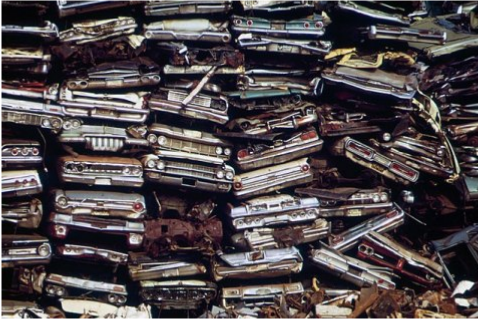
Autofriedhof in Philadelphia

Barrel-Preis stürmt von drei auf fünf und schließlich auf zwölf Dollar. Die Bundesregierung unter Willy Brandt (SPD) reagiert mit Sonntagsfahrverboten und scharfen Tempolimits: 80 km/h auf Landstraßen, 100 auf der Autobahn. Brandt wollte ein Signal setzen und „den Menschen zeigen, dass wir anders leben müssen“, blickt Gerhart Baum auf den Schock der Ölkrise zurück.