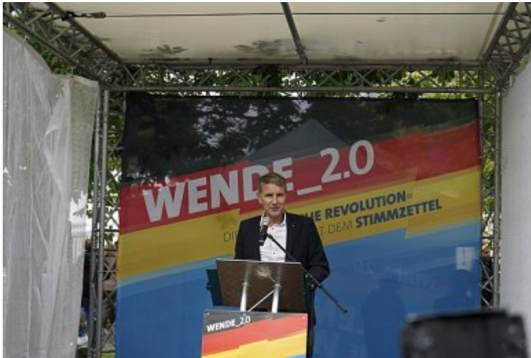
MdB Björn Höcke 2019 bei einer Kundgebung in Mödlareuth.

Wenn die AfD den jetzigen Zuspruch halten will, muss sie dann noch radikaler oder weniger radikal werden?