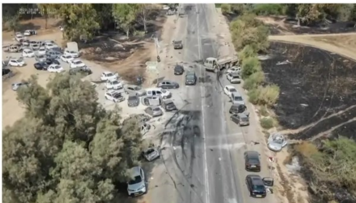
Ein Ausschnitt aus einem UGC-Video, das auf dem Telegram-Kanal "South First Responders" gepostet wurde, zeigt verlassene und zum Teil völlig zerstörte Fahrzeuge auf dem Gelände des Supernova-Musikfestivals in der Negev-Wüste im Süden Israels nach dem Angriff der islamistischen Hamas.

Heute ist die bedingungslose Unterstützung von allem, was die israelische Regierung tut, auch problematisch. Neulich sagte mir ein Kollege, dass er, wenn nach einem Statement gefragt werde, zunächst die Schutzweste anziehe, indem er den Hamas-Terror scharf verurteile. Eine Schutzweste brauche ich nicht. Oder muss ich erzählen, wie ich zwei Tage lang vor Schock und Entsetzen sprachlos war, bis mir später einfiel, dass mich Hamas beinahe direkt getroffen hätte? Denn eine meiner Töchter - wir sind auch israelische Staatsbürger - hatte eine Reise nach Israel geplant, die sie kurzfristig verschieben musste. Da sie eben Raves mag, wäre sie auf dem das Supernova-Festival nahe dem Gazastreifen gewesen. „Klar,“ sagte sie, als wir telefonierten, „Das ist ein weltbekannter Rave, da wollte ich immer hin.“ Danach könnte ich nur zittern.