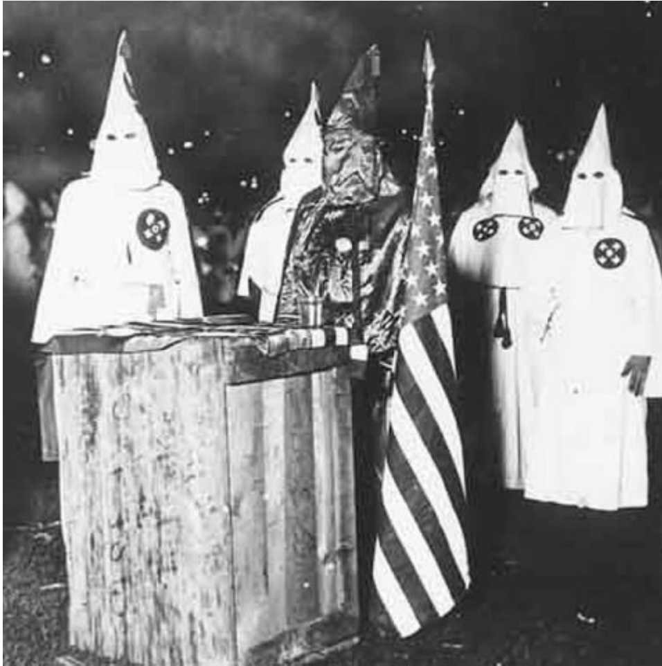
Ku klux klan, März 2020

Allerdings: es gab drei Synagogen in Atlanta, Georgia, und es hat einen Grund, warum unsere zum Terrorziel wurde. Der Rabbiner war ein Mitstreiter von Martin Luther King. Die meisten Juden waren zu verängstigt, um sich an die Seite der Bürgerrechtsbewegung zu stellen. Aber dieser Rabbiner (zusammen mit einigen wenigen Gemeindegliedern, darunter meine Mutter) hat es gewagt, im Namen der jüdischen universalistischen Tradition, die in der Bibel verankert ist. Bis heute gibt es eine tiefe Verbindung zwischen dieser Synagoge und der Ebenezer Baptist Church, der Kirche Martin Luther Kings. In dieser stolzen Tradition bin ich aufgewachsen. Sie lehrt uns: weil Juden Fremde in Ägypten waren, sollen wir uns immer auf die Seite der Fremden und Diskriminierten stellen.