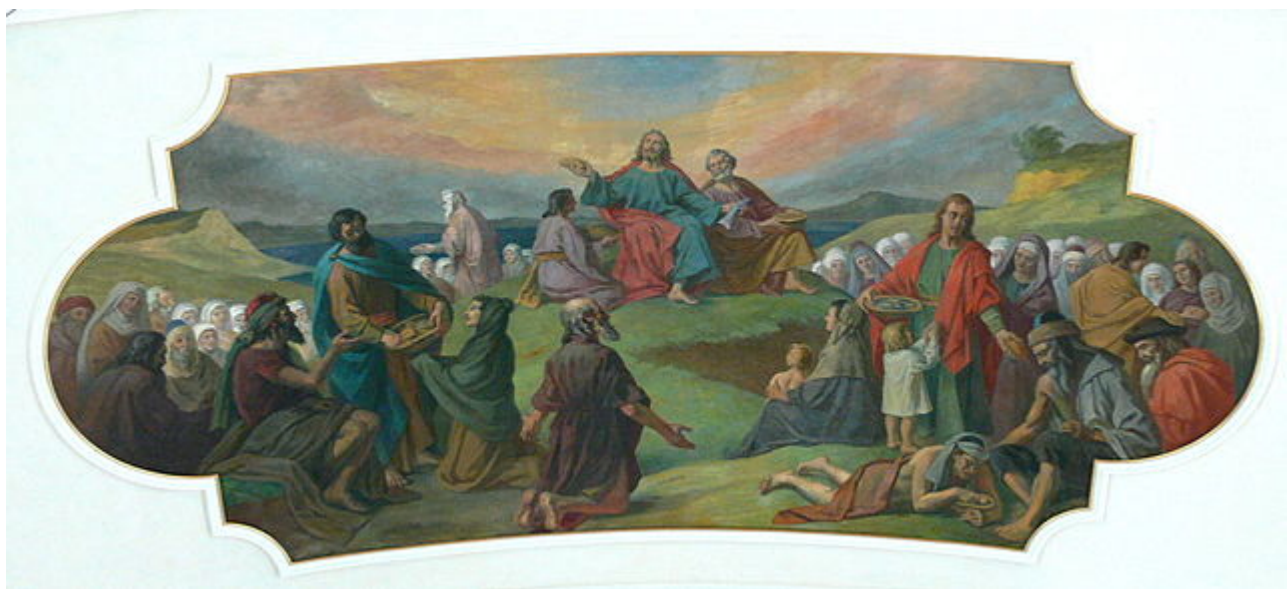
Bezau ( Vorarlberg ), Pfarrkirche St. Jodok: Fresko ( 1925 ) mit Speisung der 5000 von Ludwig Glötzle

Das Team selbst vergleicht die erwartete Produktivitätsexplosion ohne jede Selbstironie mit dem biblischen Wunder der Speisung der Fünftausend durch Jesus: „Auch Jesus konnte Friedfertigkeit nur durch ein Wunder sichern, `dieses Wunder` ist heute auf der Basis enorm entwickelter Produktivkräfte der menschlichen Arbeit möglich geworden.“ (Bd. 4, S. 382). Also kann und muss man die Produktivitätsexplosion als säkulares Heilsversprechen interpretieren. Es ist nicht das eschatologische Jenseits der Religionen, nicht die Aufhebung aller Klassen als Ergebnis der Klassenkämpfe, sondern Freiheit und Frieden durch den Überfluss an allem im Diesseits.