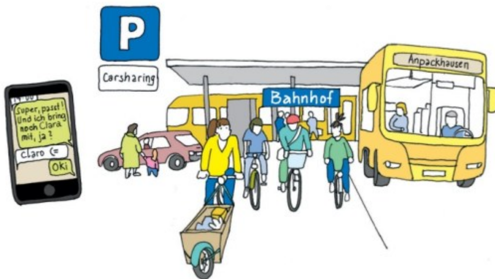
Illustration: Grit Koalick

Fahrrad: Für viel mehr regelmäßige (und unregelmäßige) Fahrten als früher nehmen die Menschen in Anpackhausen heute ihr Fahrrad. Warum? Weil jetzt alle ein Elektro-Fahrrad haben? Nicht ganz. Das Mehr an Fahrradfahrten liegt vor allem daran, dass der Radweg in die kleine Nachbarstadt und zum dort gelegenen Bahnhof mittlerweile ausgebaut worden ist. Die örtlichen Landwirt:innen haben sich zusammengeschlossen, einen schmalen Streifen ihrer Flächen zum Weg umgebaut, den sie praktischerweise für ihre Trecker gleich mitnutzen können, und damit eine schnellere Wegeverbindung zum Bahnhof ermöglicht. Es gab zudem eine Spendenaktion, so dass der Weg zusammen mit der Gemeinde finanziert und gebaut werden konnte. Wenn man die Fahrtzeiten miteinander vergleicht, dauert es mit dem Rad bis zum Bahnhof bloß wenige Minuten länger als mit dem Auto. Am Bahnhof steht seit ein paar Jahren zudem ein sicherer und überdachter Fahrradabstellraum. Und im Winter, wenn sonst Eis und Schnee Fahrradfahrten behinderten, räumen die Landwirt:innen aus Anpackhausen immer gleich den Radweg. Natürlich tragen auch die Verkehrsberuhigungen und Temporeduzierungen im Dorf dazu bei, dass Fahrräder (mit oder ohne Elektromotor, mit oder ohne Anhänger, mit oder ohne Fahrradtasche) jetzt viel präsenter und normaler sind und nicht bloß gelegentlich oder für Spazierfahrten genutzt werden. Sie gehören heute wie selbstverständlich zum Ortsbild und zum vielfältigen Mobilitätsangebot dazu. Bus und