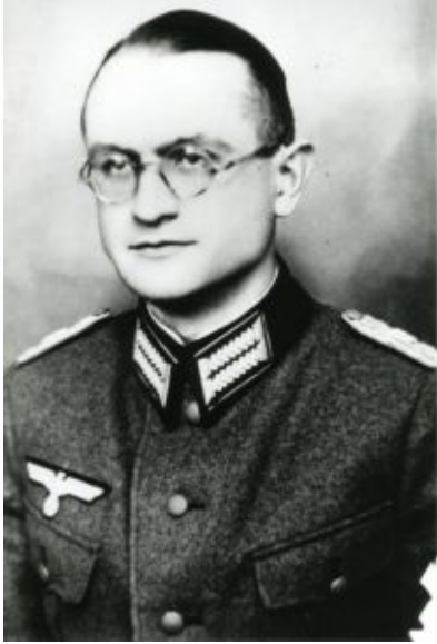
Erich Schwinge

Posted on 30. April 2024 by Helmut Ortner