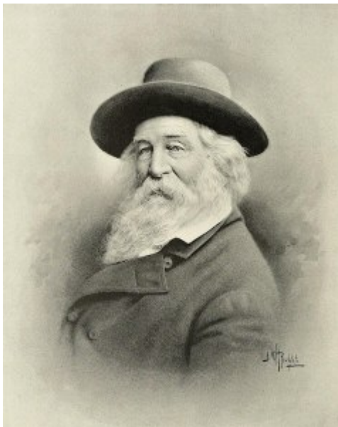
Porträt Walt Whitman