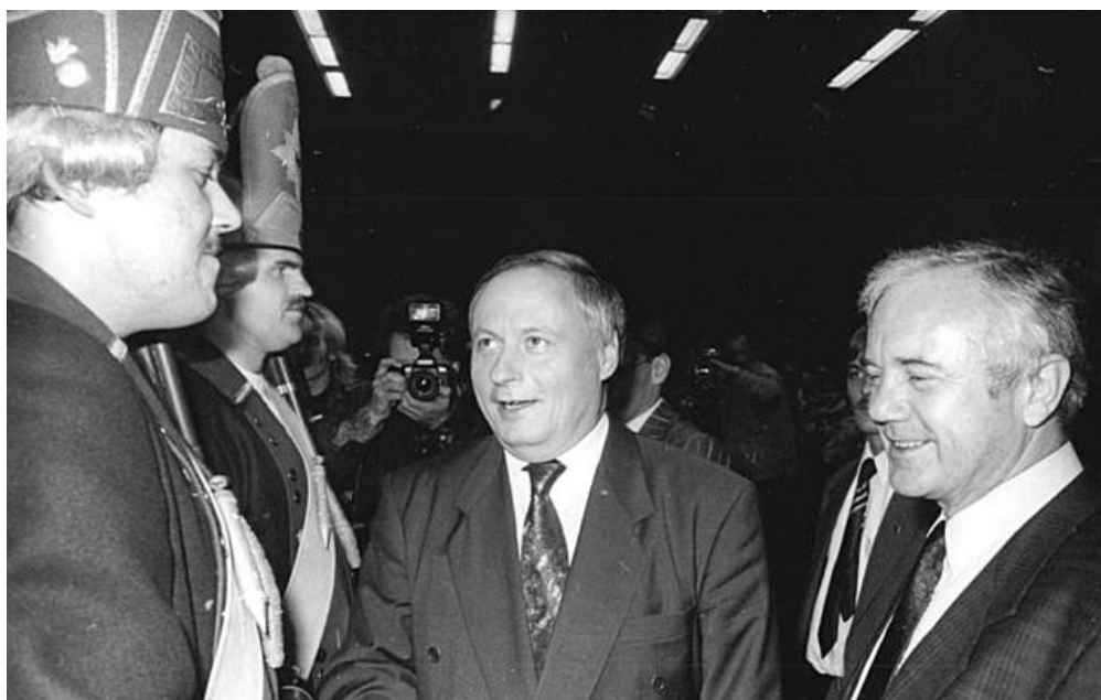
Lafontaine bei den „langen Kerls“ der preußischen Garde: Der SPD-Kanzlerkandidat zusammen mit dem späteren Ministerpräsidenten Brandenburgs, Manfred Stolpe (r.), auf einer Wahlkampfveranstaltung am 25.10.1990 in der Potsdamer Sporthalle.

Lafontaine warnte vor „nationaler Besoffenheit“ und befürchtete , „dass die Währungsunion weite Teile der Industrie- und Agrarwirtschaft der DDR schlagartig konkurrenzunfähig machen, zu ihrem Zusammenbruch und zu millionenfacher Arbeitslosigkeit führen würde. Er rechnete mit Steuererhöhungen und jahrzehntelangen Milliardentransfers“.