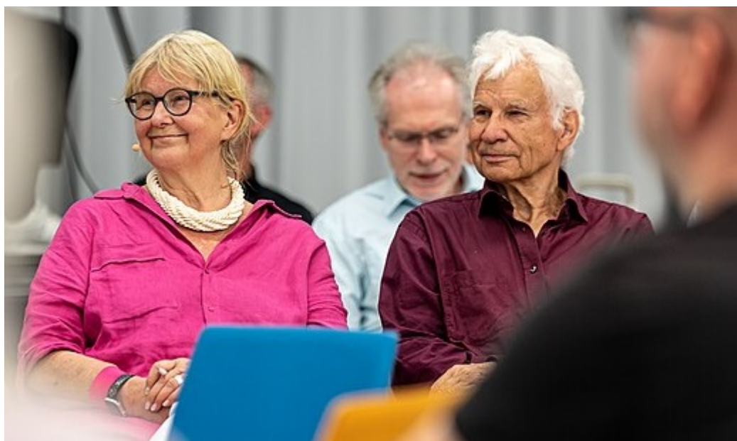
Marianne Bittthler

Neues Forum , Demokratie Jetzt und die Initiative Frieden und Menschenrechte bildeten im Februar 1990 für die Volkskammerwahl am 18. März die Listenvereinigung Bündnis 90 , die im September 1991 in eine politische Partei umgewandelt wurde und sich im Mai 1993 in Leipzig zum Bündnis 90/Die Grünen zusammenschloss. Marianne Birtthler, von 2000 bis 2011 Bundesbeauftragte für die Unterlagen des Staatssicherheitsdienstes der DDR, war eine führende Politikerin von Bündnis 90.