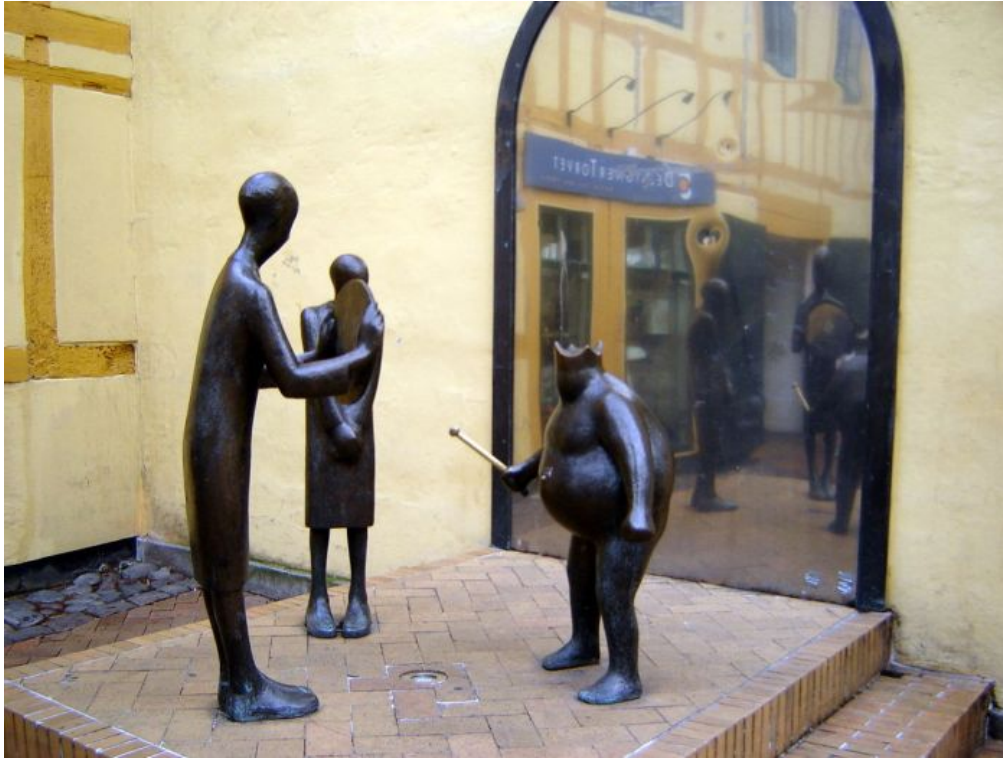
Ein Fall kognitiver Dissonanz: Des Kaisers neue Kleider

Und was dann? Naja, wie geht denn die menschliche Psyche üblicherweise mit Differenzenerfahrungen um? Solche kognitiven Dissonanzen sind belastend und das psychische System ist bemüht, sie auszulöschen oder zu reduzieren, also diese Erfahrungen zu ignorieren und zu verdrängen. Verstrickt mit der vereinnahmenden digitalen Welt werden die Repräsentanten der ersten Realität (etwa Wissenschaftler, Massenmedien, usw.) ignoriert, entwertet und verleumdet. Einer unendlichen Zahl von „Mein-ungen“ stehen kaum mehr „Unser-ungen“ gegenüber - und dann gibt es eben keinen menschengemachten Klimawandel, und damit basta. Und andere Menschen? Die zunehmende Narzissifizierung der Wahrnehmung bringt den Blick, den Anderen zum Verschwinden. Wenn ich meine Sicht der Welt für allgemein verbindlich halte (bei all dem Applaus, den ich bekommen habe, muss das ja wohl so sein), dann ist ein Zusammentreffen mit Menschen mit anderen Auffassungen ein Schock, eine Zumutung. Da ist sie wieder, die kognitive Dissonanz, die reduziert gehört - Meideverhalten ist angesagt.