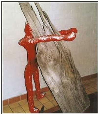
EINE NEUBRANDENBURGER VORLESUNG