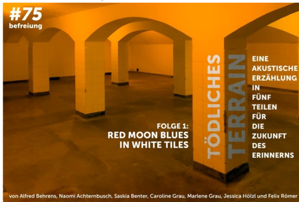
Tödliches Terrain. Akustische Erzählung für die Zukunft des Erinnerns (Folge 1) - Filmuni Babelsberg

Posted on 22. Dezember 2024 by Helmut Ortner