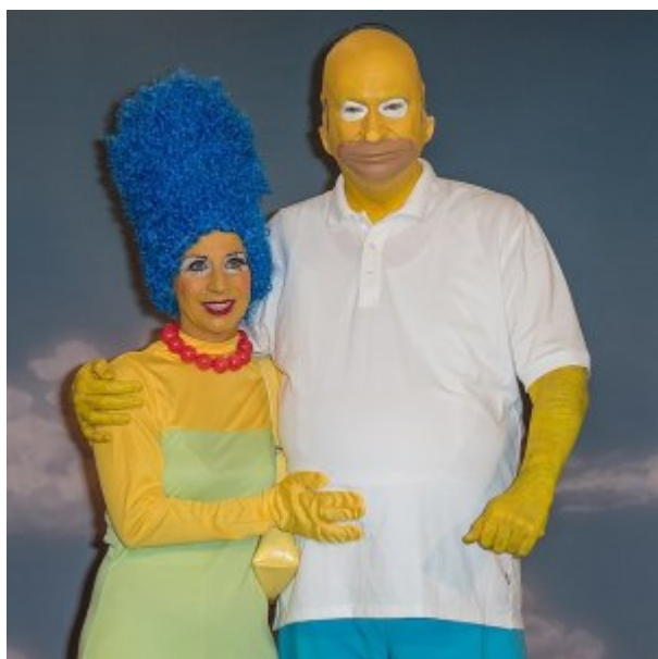
Fastnacht in Franken 2017: Karin Baumüller-Söder + Markus Söder

Markus Söder, bekannt für seinen Chamäleon-Charakter, wäre, wenn er in Bayern Freie Wähler und AfD mit seiner Strategie relativ klein halten konnte, der erste, der antritt, das auch in einer von ihm geführten Regierung mit der AfD zu bewerkstelligen. In Anlehnung an Gerhard Schröder, der ja in der Union in Mode gekommen ist, wäre im Unterschied zu Österreich die Union, so die beruhigende Selbsttäuschung, der „Koch“ und nicht der „Kellner“. Die Aversion der Unionsparteien gegen die Grünen, gegen Cannabis und Gendern, gegen doppelte Staatsbürgerschaft und schnelle Einbürgerung, von der nahtlosen Übereinstimmung in den Eckpunkten der Asylpolitik und Migrationsfeindlichkeit mit der AfD ganz zu schweigen, könnten dafür den Grund legen.