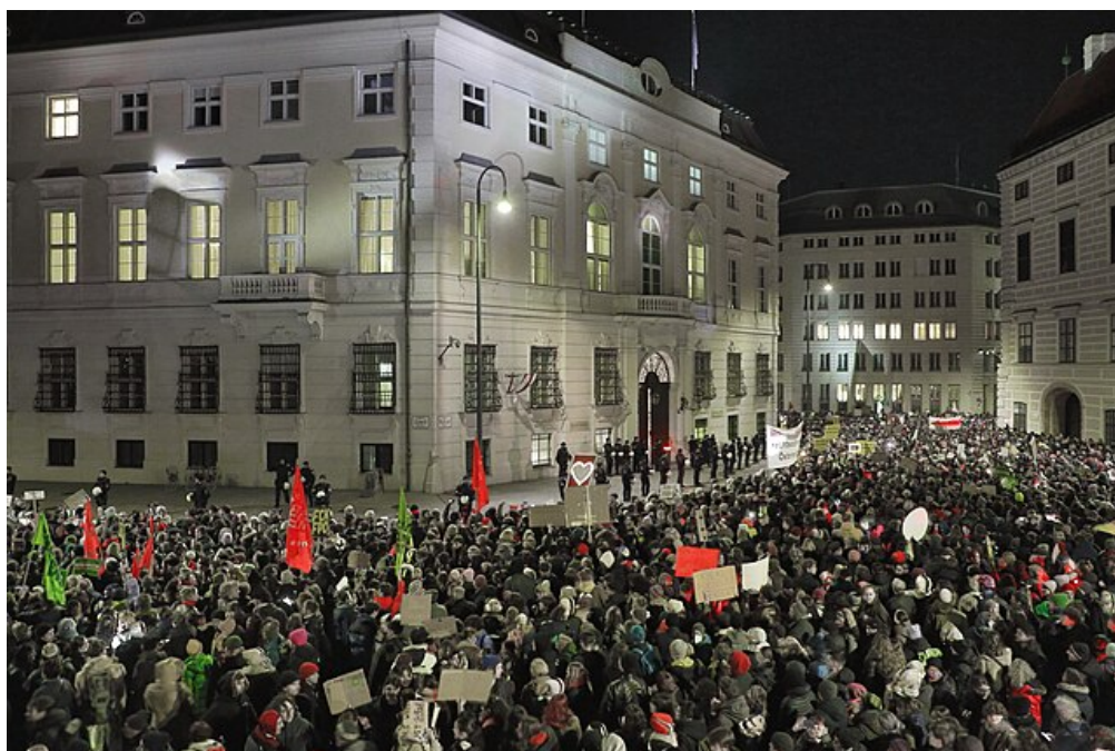
Demonstration gegen eine FPÖ-Regierung | Wien, 09. Januar 2025

Bezüge zu Österreich sind, gerade wenn es um Rechtsextremismus und Neonazis geht, historisch belastet. Es sollte aber nicht aus dem Gedächtnis verschwinden, dass 1925 die NSDAP nach dem Verbot neu und die „Schutzstaffel“ SS erstmals gegründet wurden . Denn nach 100 Jahren haben wir wieder ein politisches Klima, in dem eine gewalttätige Sprache immer öfter in Gewalt-Taten umschlägt. Das österreichische Drama veranlasst nachzudenken: Zum einen, demokratische Parteien in einem politischen Spektrum rechts und links der Mitte, das nicht so weit gefächert ist, sind nicht in der Lage einen Kompromiss zu finden für eine gemeinsame Politik, die den Rechtspopulisten den Weg in die Regierung verwehrt und ihnen den Boden für weiteres Wachstum entzieht. Zum anderen wird ein zentrales Wahlversprechen der ÖVP, nicht mit der FPÖ und Kickl zu koalieren, aus Opportunitätsgründen von einer Minute auf die andere über den Haufen geworfen. Exekutiert wird dieser Wortbruch gerade von Christian Stocker, genau der Person, die als ÖVP-Generalsekretär den Wortbruch zugunsten Kickls und dessen FPÖ vehement ausgeschlossen hatte. Zum dritten verschieben sich die Gewichte in Europa weiter zu EU-Feindlichkeit, Asyl- und Migrationsabwehr und Russlandnähe. Ein weiteres Land der EU hat einen Regierungschef, der die Abwehrkraft Europas gegen die Zerstörung der liberalen Demokratie gezielt schwächt.