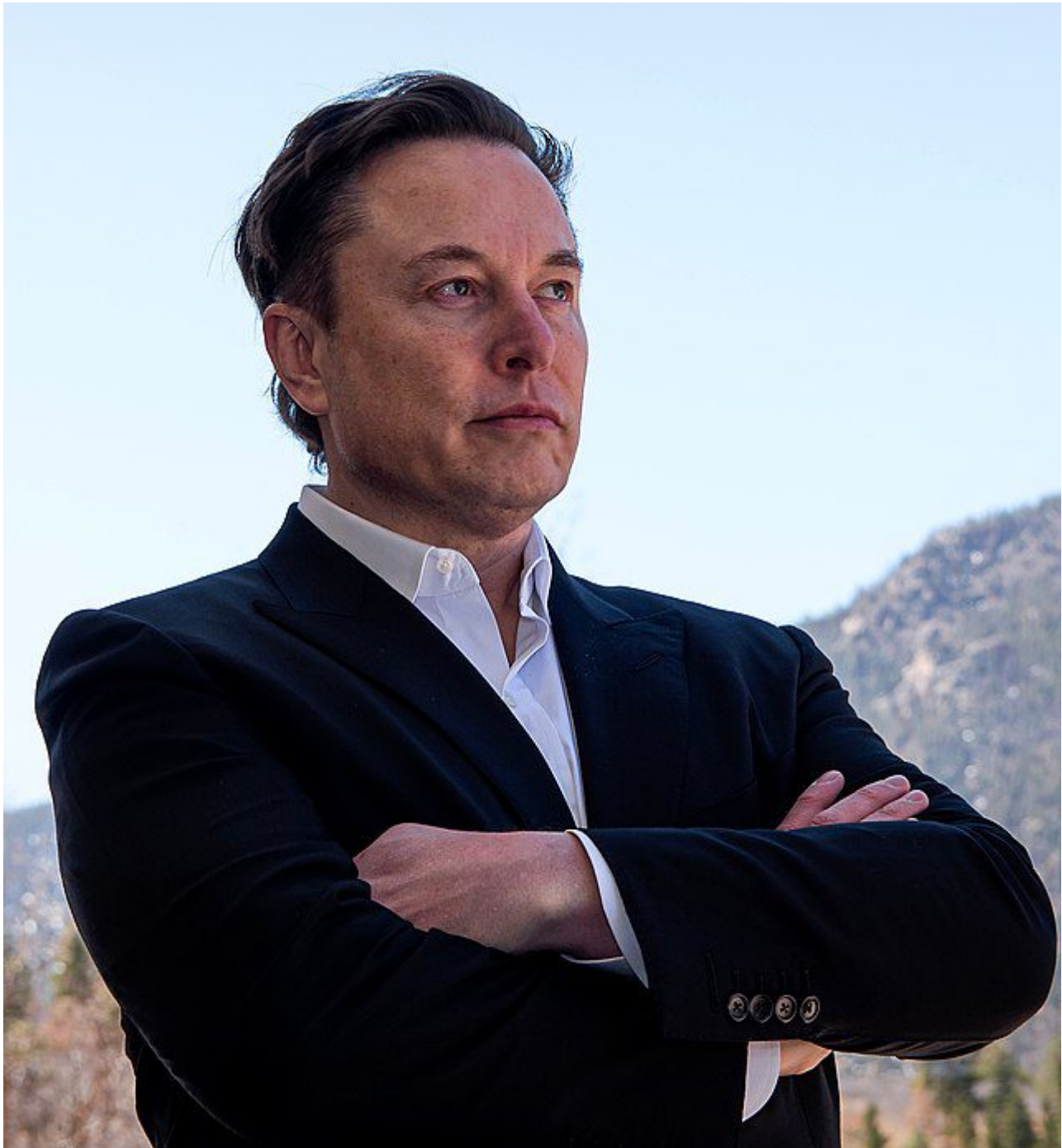
U.S. AIR FORCE ACADEMY, Colo. — Tesla Inc. Chief Executive Officer Elon Musk after arriving outside of Arnold Hall for the Ira C. Eaker Distinguished Speaker Presentation on April 7, 2022 at

die völlige individuelle Freiheit und uneingeschränkte Selbstbestimmung zum alleinigen Maßstab macht.