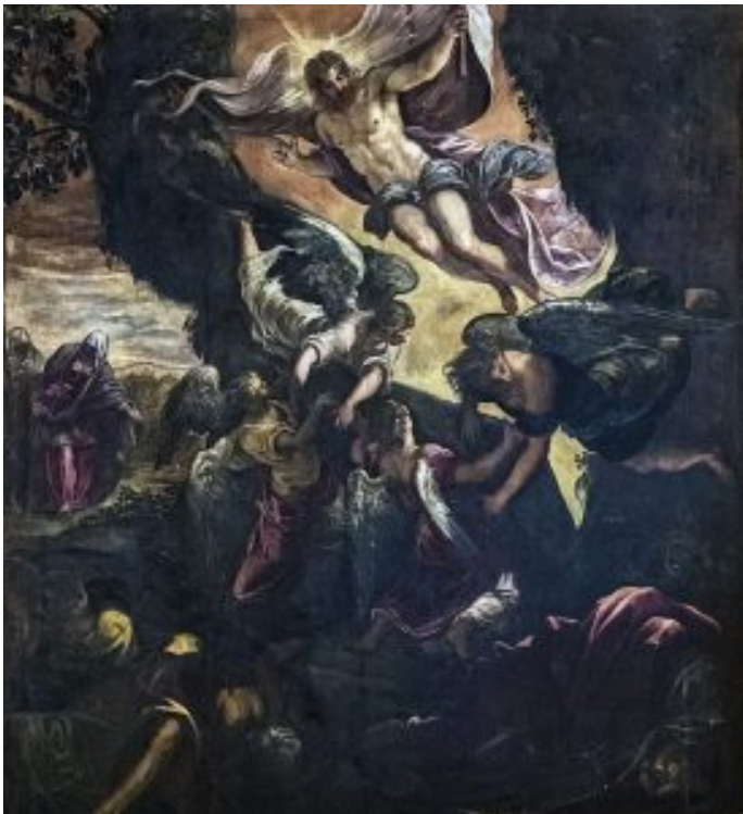
Jacopo Tintoretto: The Resurrection of Christ

Die Gegenwart ist auch geprägt von Vernichtung pflanzlichen, tierischen, menschlichen Lebens, dystopischen Programmen und politischen Kräften, die sich um Recht und Gesetz immer weniger scheren. Vor aller Augen verbünden sich politische Macht und finanzieller Reichtum und entwickeln milliardenschwere Projekte, die sich von einem besseren Leben für die Bevölkerung endgültig verabschiedet haben. Es geht bei diesen Projekten um Rückzugsorte, um eigene Lebensverlängerung, persönliche Überlebensstrategien auf einem Planeten, der generell wohl als immer weniger lebenswert und überlebensfähig eingeschätzt wird. Es sind libertäre Freiheitsphantasien weniger Individuen, die ihrer Gier nach Macht und Geld ohne jegliche gesellschaftlichen Regeln und Verpflichtungen als unsterbliche Egos frönen und damit die Erde und am liebsten auch den Kosmos beherrschen wollen.