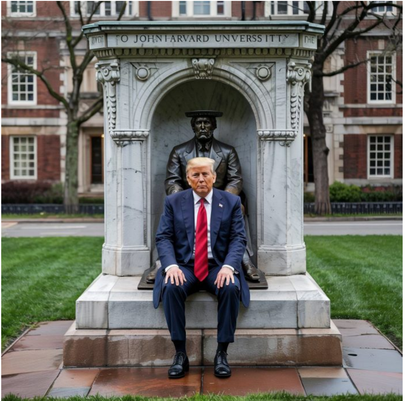
Harvard heute.

Der aktuelle Konflikt in den USA zwischen weitrechter Regierung und Universitäten enthält eine aufschlussreiche Botschaft für den Umgang mit Rechtsaußen. (Die Bezeichnung faschistisch, wissenschaftlich durchaus zu begründen, wird hier umgangen, weil „Faschismus“ unvermeidlich auch als politischer