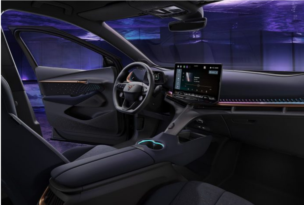
CUPRA Tavascan, vollelektrischer SUV

Ein gutes Beispiel für die Übernahme einer innovativen Kultur eines ausländischen Unternehmens ist das spanische Unternehmen SEAT, eine Tochtergesellschaft von Volkswagen. SEAT hat aus seiner Sportabteilung eine eigenständige Marke namens Cupra geschaffen, die heute mit dem Cupra Tavascan ein vollelektrisches SUV-Coupé anbietet. Dieses Fahrzeug wurde in Barcelona entworfen, wird jedoch in China hergestellt. Im Jahr 2026 wird SEAT einen neuen elektrischen Cupra, den Cupra Raval, in seinem katalanischen Werk in Martorell produzieren.