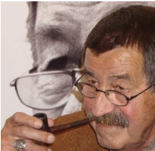
Günter Grass

Schädlich's Beziehung zu Grass ist ein Kapitel für sich. Als die DDR-Regierung ihm alle Verdienstmöglichkeiten entzieht, unterstützt ihn Grass mit großem Engagement und hilft ihm, im Westen Fuß zu fassen. Das Zerwürfnis kommt nach der Wiedervereinigung. In seinem Roman „Ein weites Feld“ nennt Grass die DDR eine „kommode Diktatur“. Dafür erntet er scharfe Kritik von Schädlich, das Stasi-System zu verharmlosen: „Wie ‚angenehm‘ diese Diktatur war, hättest Du von Leuten wissen können, die Erfahrungen mit der Stasi gemacht