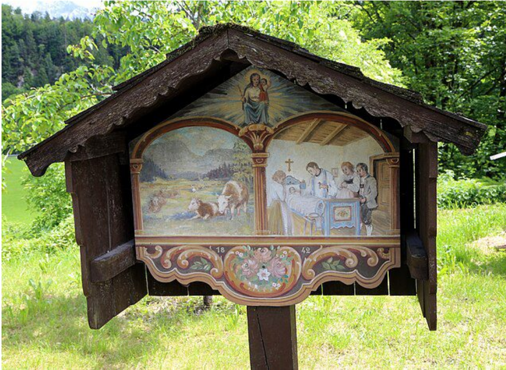
Marterl Schoeffau Kiefersfelden

dem altklugen Ton, den er gewöhnlich draufhat, aber wie ich den Betrieb kenne, wird es wohl das liebe Jesulein sein.