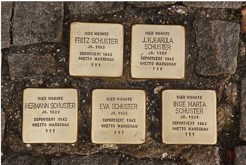
Erinnerungskultur: Stolpersteine in Bernau bei Berlin

Einstellungen ab - nämlich 76,1 Prozent. Zugleich sei allerdings eine zunehmende Normalisierung antidemokratischer und menschenfeindlicher Aussagen festzustellen - weit in die sogenannte Mitte hinein. Und hier sind wir bei der schlechten Nachricht: 19,8 Prozent stimmen nationalchauvinistischen Aussagen zu, ein Viertel der Bevölkerung meint gar: „Was Deutschland jetzt braucht, ist eine einzige starke Partei, die die Volksgemeinschaft insgesamt verkörpert.“ Die Studie zeigt: die Zustimmung für völkische Parolen ist gestiegen. So denken 23 Prozent: „Das oberste Ziel der deutschen Politik sollte es sein, Deutschland die Macht und Geltung zu verschaffen, die ihm zusteht.“ Und 15 Prozent sagen: „Wir sollten einen Führer haben, der Deutschland zum Wohle aller mit starker Hand regiert.“ Begriffe wie »Volk, Volksgemeinschaft, Führer«, allesamt NS-kontaminierte Begriffe, finden wieder Verwendung - nicht nur im nationalgesinnten Gedankengebräu rechtsextremer „Patrioten“.