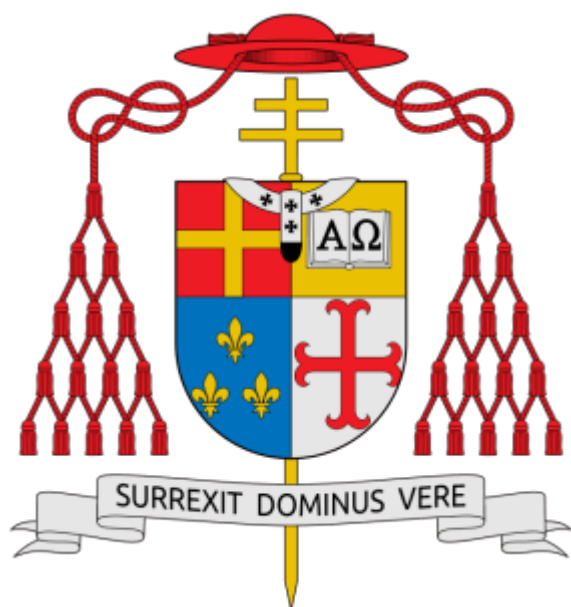
Wappen des Kardinals Johannes Joachim Degenhardt