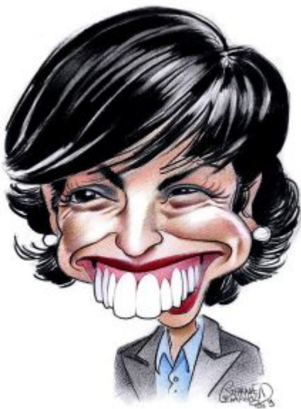
Karikatur Rachida Dati

Ein genauere Blick auf das Geschehen in den 34 875 Kommunen, in denen zu wählen war, ist ernüchternd und konfrontiert die lautstarken Polarisierer (männlich und weiblich) mit einer völlig anderen Realität: In neun von zehn Kommunen war die Wahl bereits am 15. März bei teilweise extrem niedriger Wahlbeteiligung entschieden: Sei es, weil die oft parteilosen Kandidatinnen und Kandidaten („sans étiquette“) seit Jahren, wenn nicht Jahrzehnten bekannt, einflussreich, finanzpolitisch außerordentlich trickreich und spendabel gegenüber Handel und Vereinen sind; sei es, weil vor Ort in 68 Prozent der Fälle nur eine einzige Liste existierte, der Wahlzettel bereits gefaltet und zum Einstecken in die Urne vorbereitet war: Der bisherige beliebte „Volkssport“, in den Einheitslisten fröhlich zu streichen oder neue Namen hinzuzufügen, ist mit einer Wahlrechtsreform vor acht Jahren unterbunden worden. Sie sollte die vorgeschriebene Parität zwischen Männern und Frauen auf den Listen nicht gefährden.