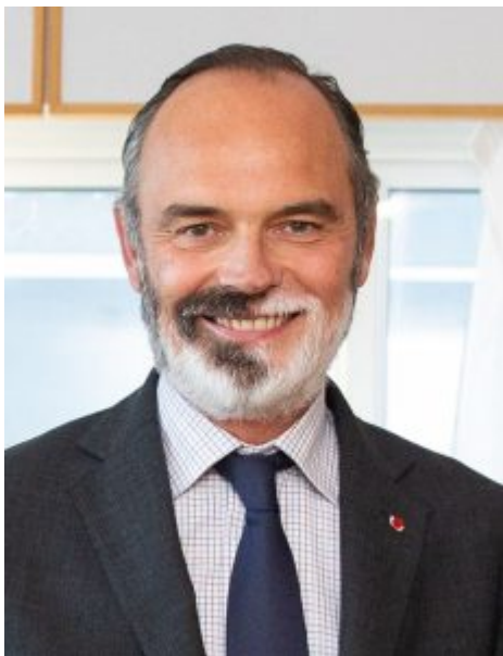
Édouard Philippe

In der rechten Mitte ernannte sich bereits im vorigen Jahr der jetzt in der Stichwahl wiedergewählte Bürgermeister von Le Havre, Edouard Philippe, mit seiner Mitterrechts-Partei Horizons. Der einstige Premier-Minister in Macrons erster Amtszeit kürte sich selbst und forderte im Sommer des vergangenen Jahres (nach dem Rücktritt der Regierung François Bayrou) Emmanuel Macron spektakulär auf, seinen Stuhl im Elysee Palast vorzeitig zu räumen. Danach herrschte zwischen den beiden Männern Funkstille. Bis zum 15. März.