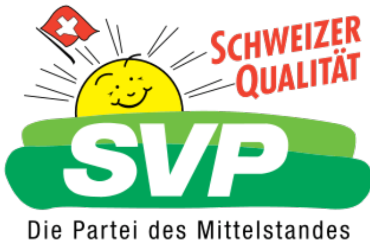
Logo der Schweizerischen Volkspartei

Wie ginge es der Schweiz ohne Zuwanderung? Ohne Zuwanderung würde sich die Überalterung der Schweizer Gesellschaft verschärfen, der Arbeitskräftemangel würde größer. Insbesondere Branchen wie Pflege, Bauwesen, Tourismus und Gastronomie sind auf ausländische Arbeitskräfte angewiesen. Das Wirtschaftsforschungsinstitut BAK Economics hat berechnet, dass eine Beendigung der bilateralen Abkommen mit der EU zur Begrenzung der Zuwanderung das Wachstum zwischen 2028 und 2045 um 7,1 Prozent schmälern würde. Das entspräche einem kumulierten Verlust von 685 Milliarden Franken (ca. 867 Milliarden US-Dollar). Ein geringeres Wirtschaftswachstum und steigende Löhne infolge des knapperen Arbeitskräfteangebots könnten die Inflationsrate in die Höhe treiben und die Zentralbank zu Zinserhöhungen zwingen; dies wiederum würde Investitionen bremsen und möglicherweise zu einer weiteren Aufwertung des Schweizer Frankens führen.